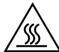
Superfície Quente IEC 60417-5041

Para identificar os riscos decorrentes de tensões perigosas.