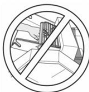
CUIDADO Risco de Esmagamento de Mãos.

Para indicar que o item marcado pode ser quente e não deve ser tocado sem cuidar.