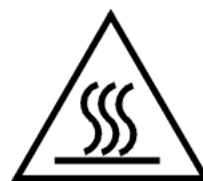
Superfície Quente IEC 60417-5041

Para identificar os riscos decorrentes de tensões perigosas