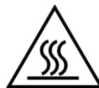
Superfície Quente IEC 60417-5041

Para identificar os riscos decorrentes de tensões perigosas