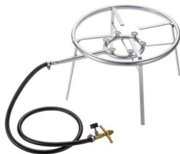
Fogareiro a Gás com 6 Caulins