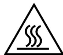
Superfície Quente IEC 60417-5041

Para identificar os riscos decorrentes de tensões perigosas